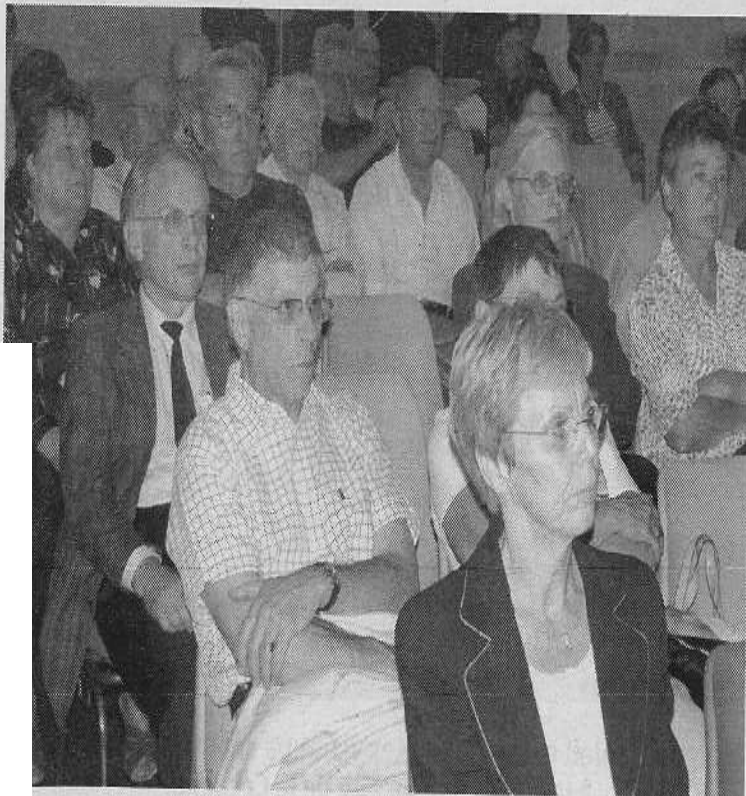
Les Adamois sont venus en nombre à la réunion publique.

À l'heure actuelle, le barrage est constitué de 364 vanettes en bois de chênes (des planches empilées), que les barragistes devaient enlever avec des crochets, les uns après les autres, en cas de crues, pour laisser s'écouler l'eau librement. Ce type de manœuvres, toujours pratiquées,